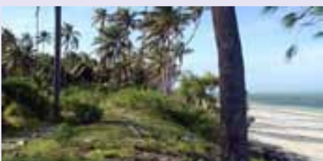
An diesem malerischen Platz ist eine Jugendherberge mit integrierter Berufsschule geplant.

Nach der Eröffnung der Schule im Dorf Ndijani geht es in hohem Tempo weiter. Im Dorf selbst wird für die 500 Schüler eine Mehrzweckhalle mit Küche und Kantine gebaut. Bereits konnten Pläne für den nächsten grossen Projektschritt gelegt werden: Den Bau einer Jugendherberge mit integrierter professioneller school. Ein Einwohner der Strandregion Jambiani auf Zanzibar möchte CAAA hierfür sein Landstück zur Verfügung stellen.