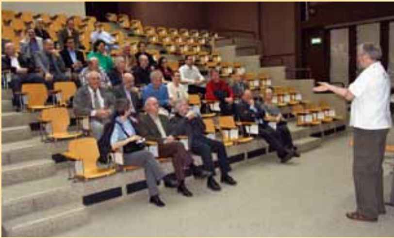
Gebannt folgen VEDA-Mitglieder den Ausführungen im Technorama.

einen anderen Becher und stelle diesen auf den Kopf» und siehe da, «es kommt kein Wasser». Wie auch immer, die Anwesenden staunten wie